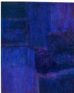
Monique Frydman Blue 2, 1999 Pigments et liants sur toile de lin 140 x 166 cm