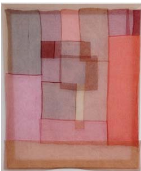
Monique Frydman Albes 1, 2005 Taratane brodée 125 x 150 cm