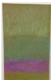
Monique Frydman Tabula 8, 2013 Pigments et liants sur toile de lin 53 x 90 cm