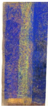
Monique Frydman Prédelle 12, 2013 Pigments et liants sur toile de lin 41 x 121 cm