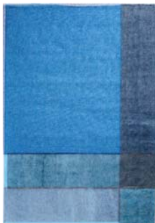
Monique Frydman Les songes 2, 2014 Taratane brodée 197 x 130 cm