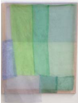
Monique Frydman Albes 2, 2014 Taratane brodée 125 x 150 cm