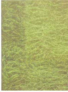
Monique Frydman Des Saisons avec Bonnard 22 , 2010 Pigments et liants sur toile 130 x 97 cm