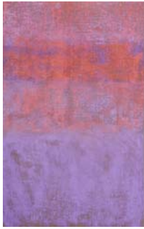
Monique Frydman Tabula 2, 2013 Pigments et liants sur toile de lin 53 x 90 cm