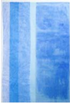
Monique Frydman Les songes 6, 2014 Taratane brodée 197 x 130 cm