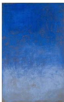
Monique Frydman Tabula 9, 2013 Pigments et liants sur toile de lin 53 x 90 cm