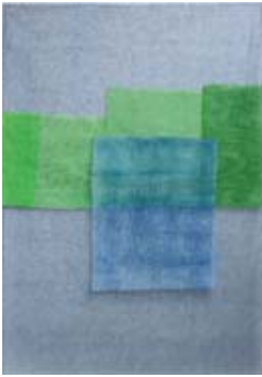
Monique Frydman Les songes 7, 2014 Taratane brodée 197 x 130 cm